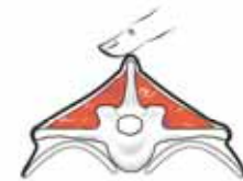
تحسس الناتئة الشوكية