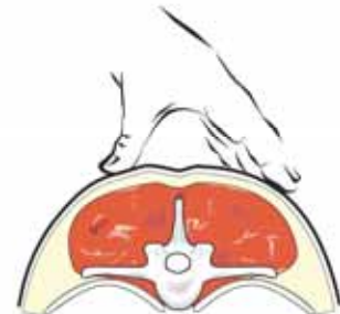
تحسس العضلات والطبقة الدهنية