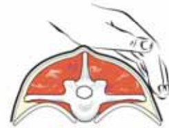
تحسس الزائدة المعترضة